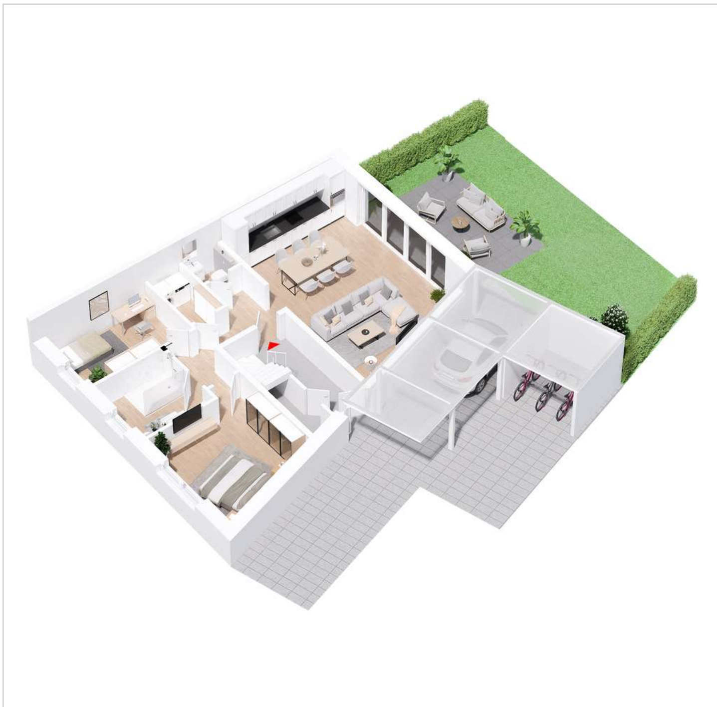
EG - Wohnung

Zimmer: 3,00 Wohnfläche ca.: 94,00 m 2 Kaufpreis: 499.000,00 EUR