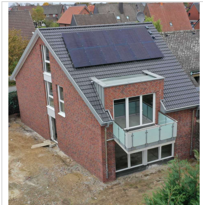
Eingang und Terrasse