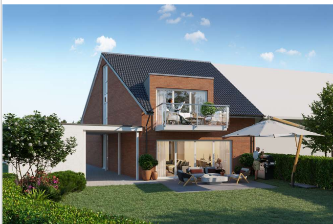
Ansicht EG - Wohnung

Zimmer: 3,00 Wohnfläche ca.: 94,00 m 2 Kaufpreis: 499.000,00 EUR