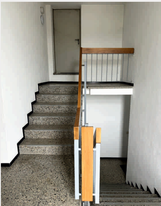
Die Ansicht des Gebäudes, der Eingangsbereich und das Treppenhaus

Aus Rücksichtnahme auf die Mieter, verwenden wir keine Innenaufnahmen